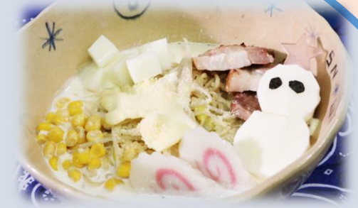
「とける雪だるまラーメン」