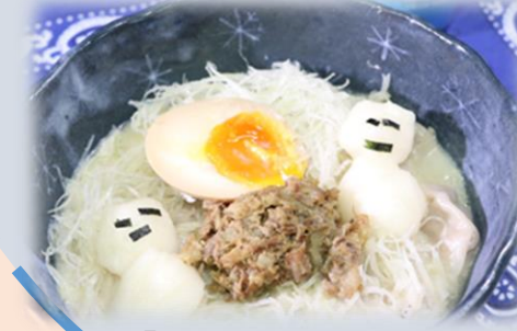
「ホワイトラーメン」