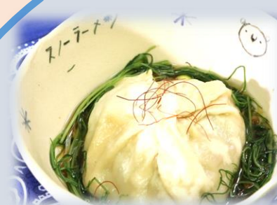
「にくまんラーメン」